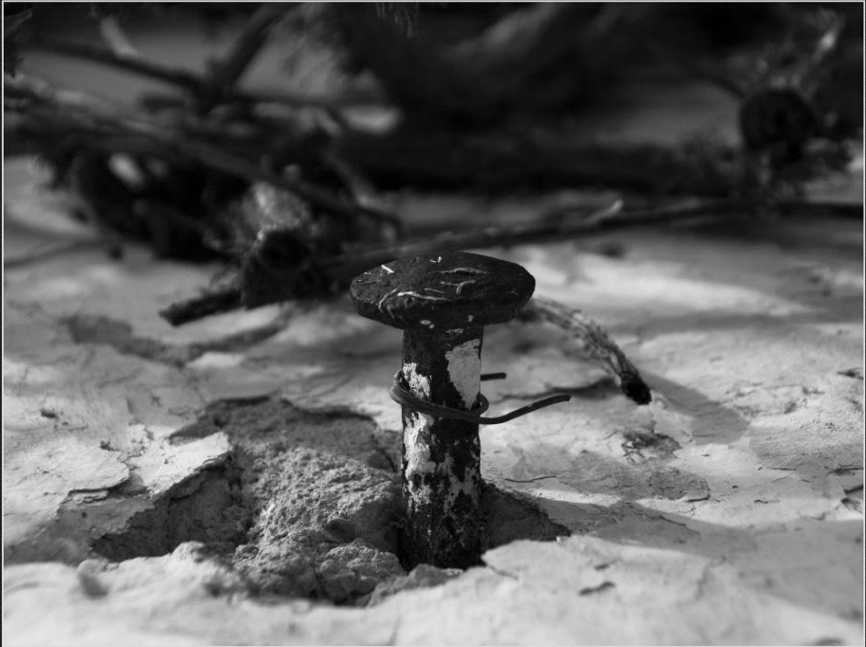
Detall casup de Cap de Martí