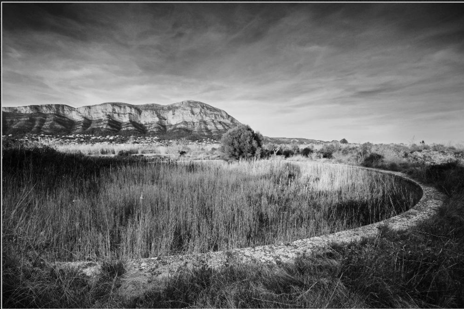
Bassa de Bolufer - Els Julians