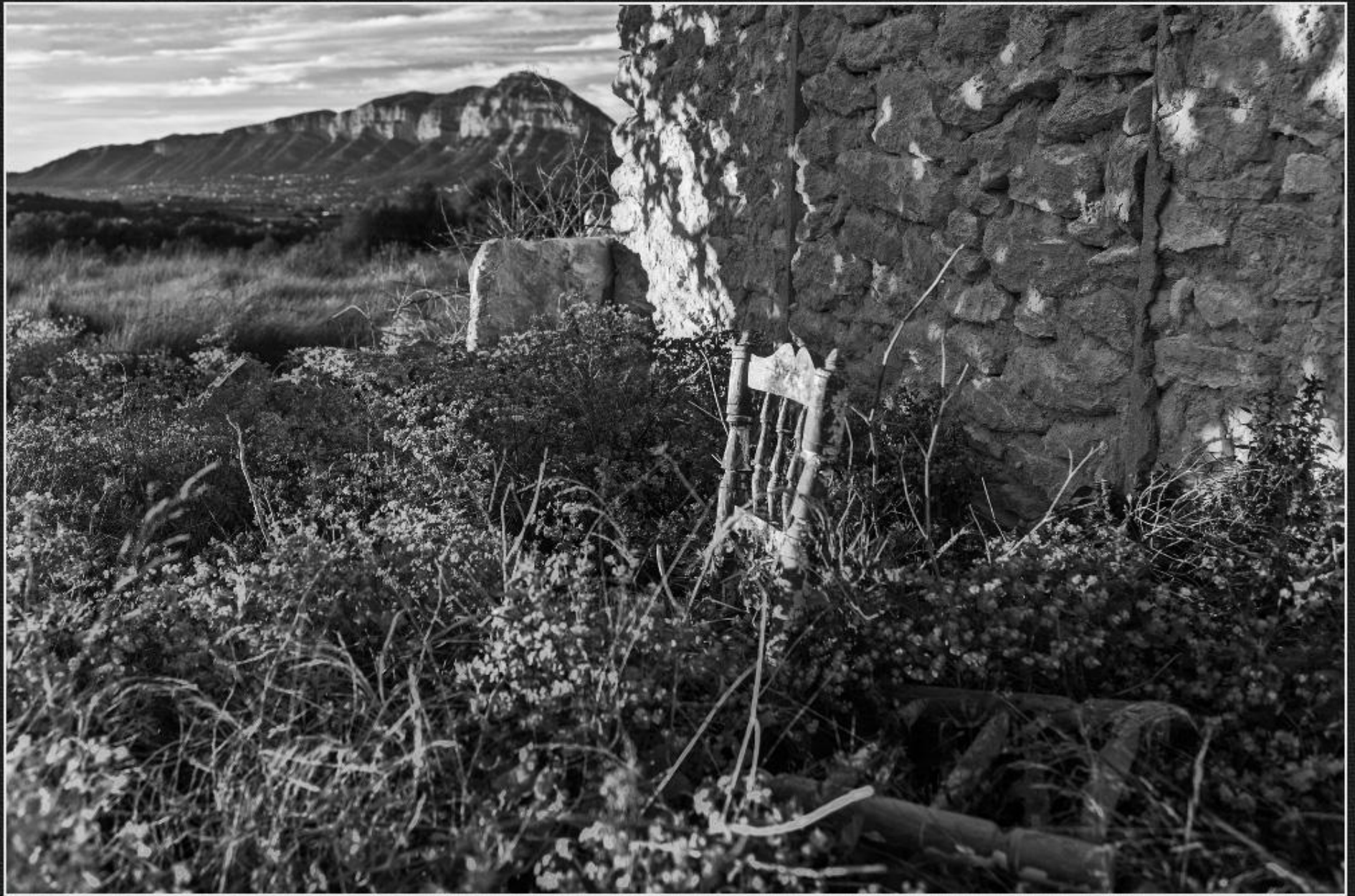
Casup Cansalades