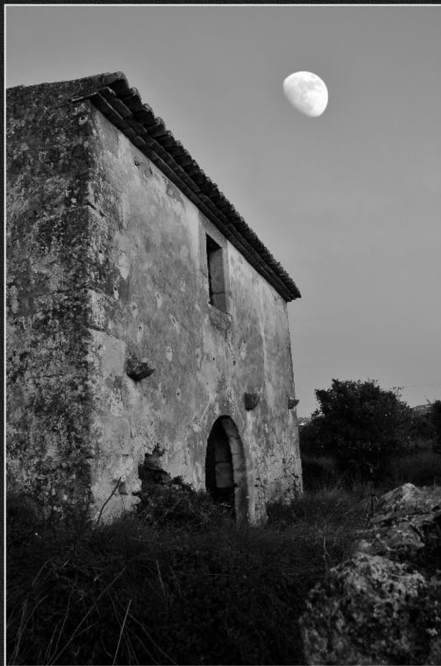
Casa de Tena - La Mesquida