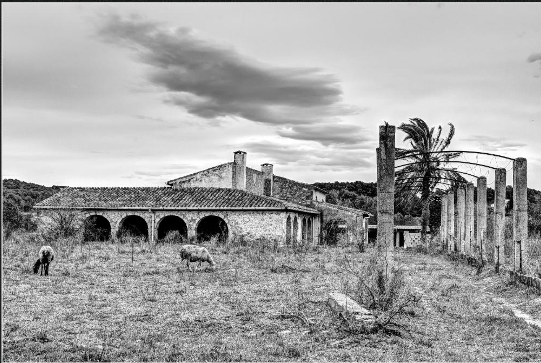
Riurau de la Pegolina - La Lluça