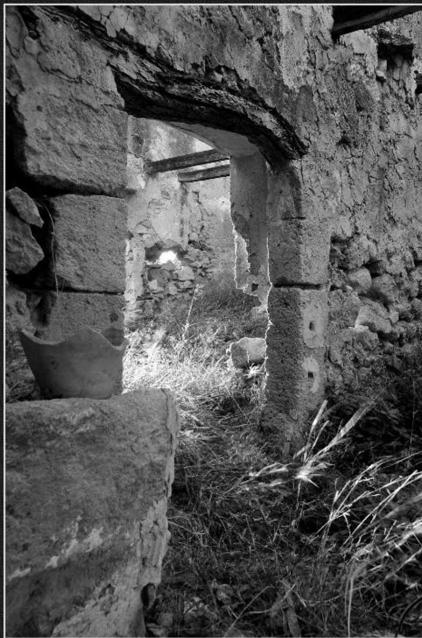
Estable casa de Tena - La Mesquida