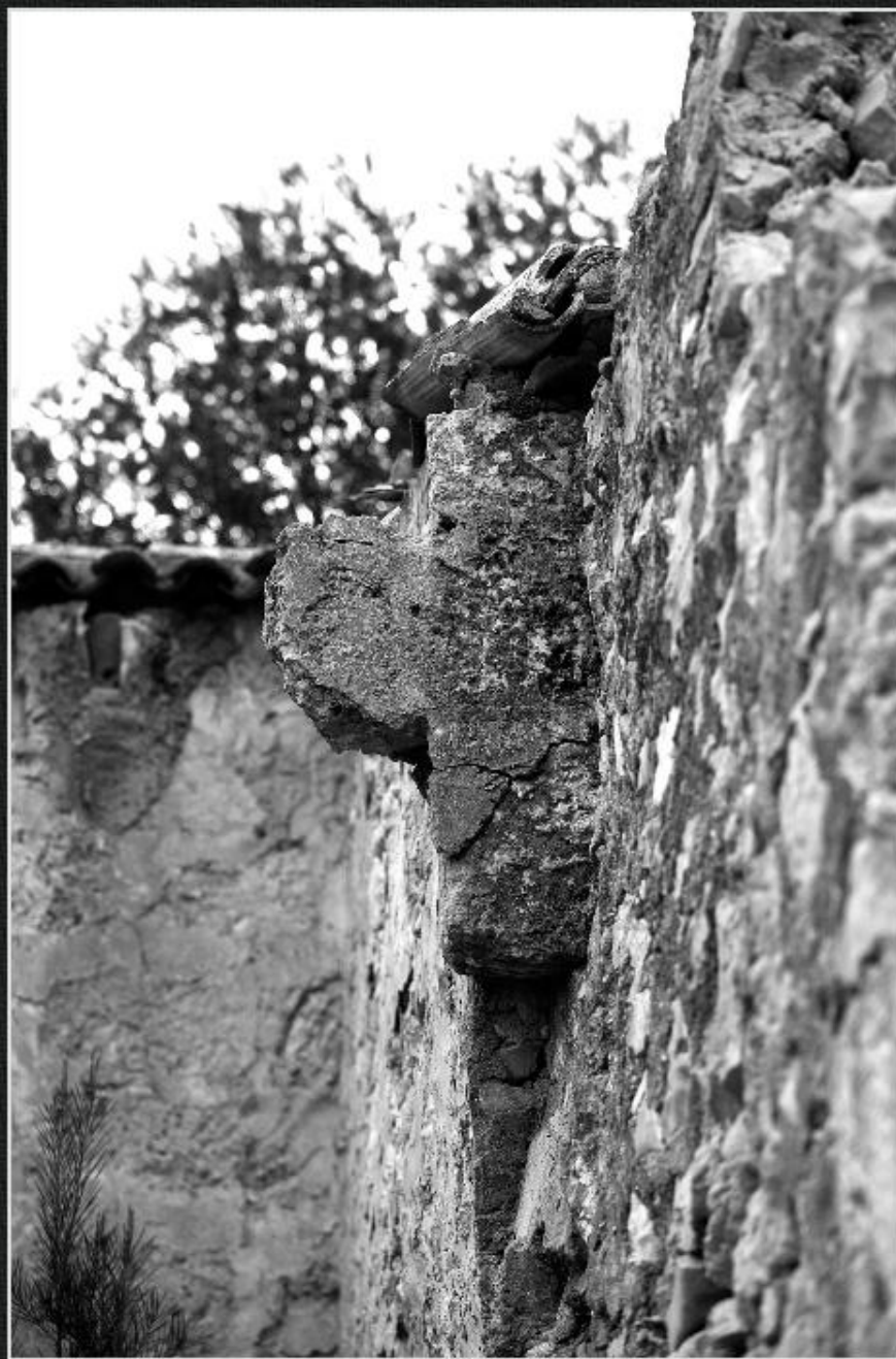
Detall casa dels Benimeli - El Rafal