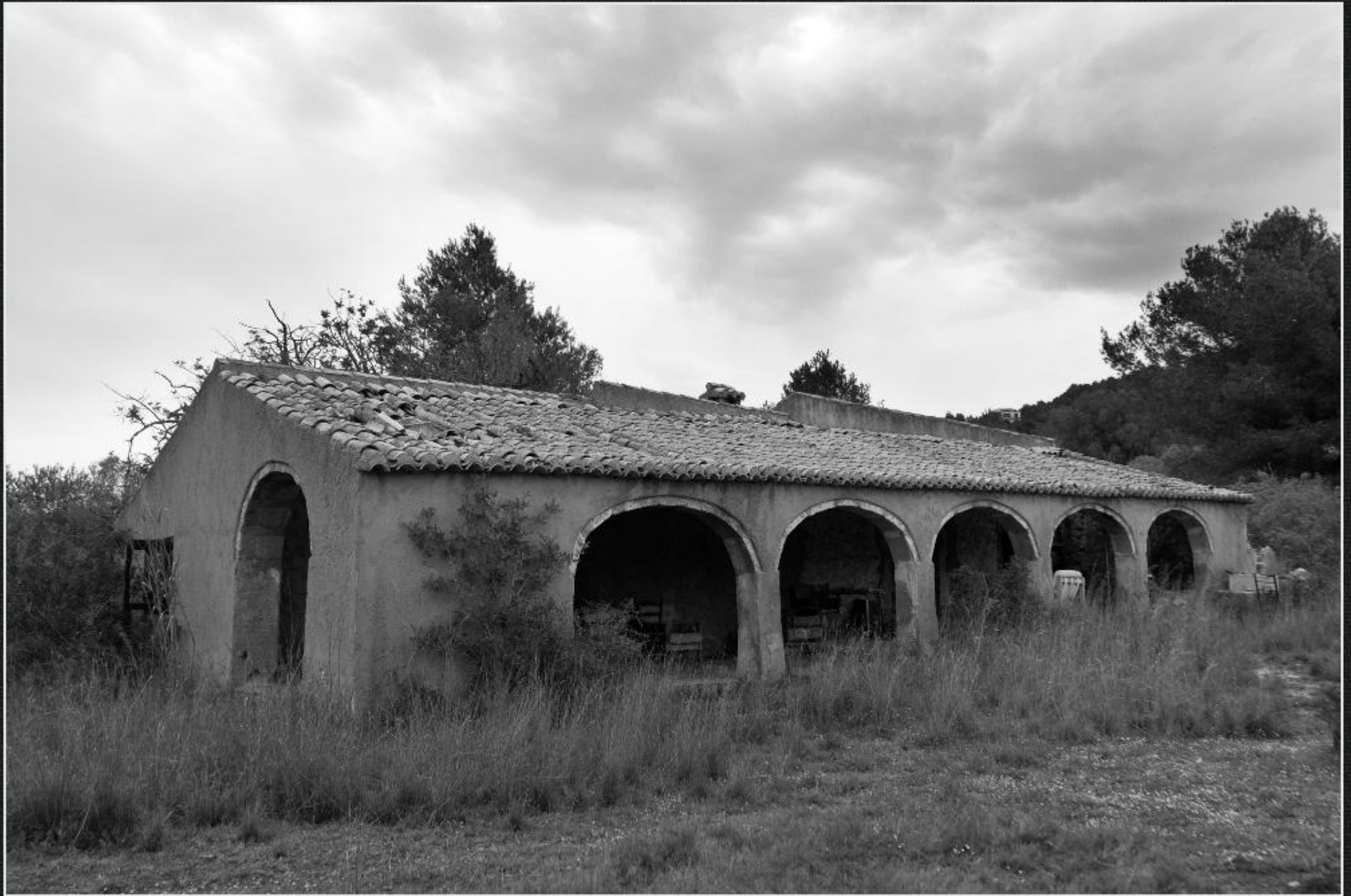
Riurau del Mosso - El Rafalet