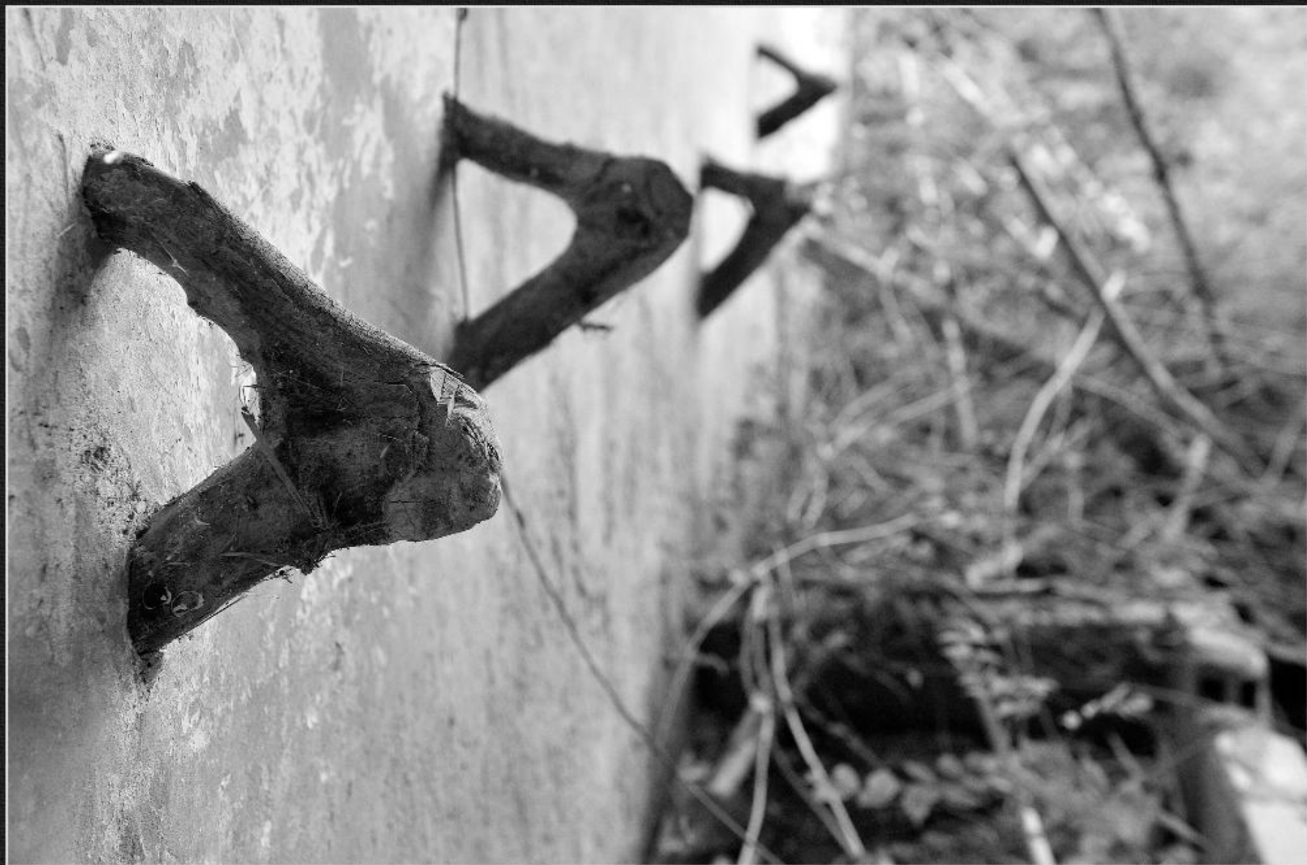
Estaques i pessebre. Caseta i bassa de Terra Soler - La Lluça