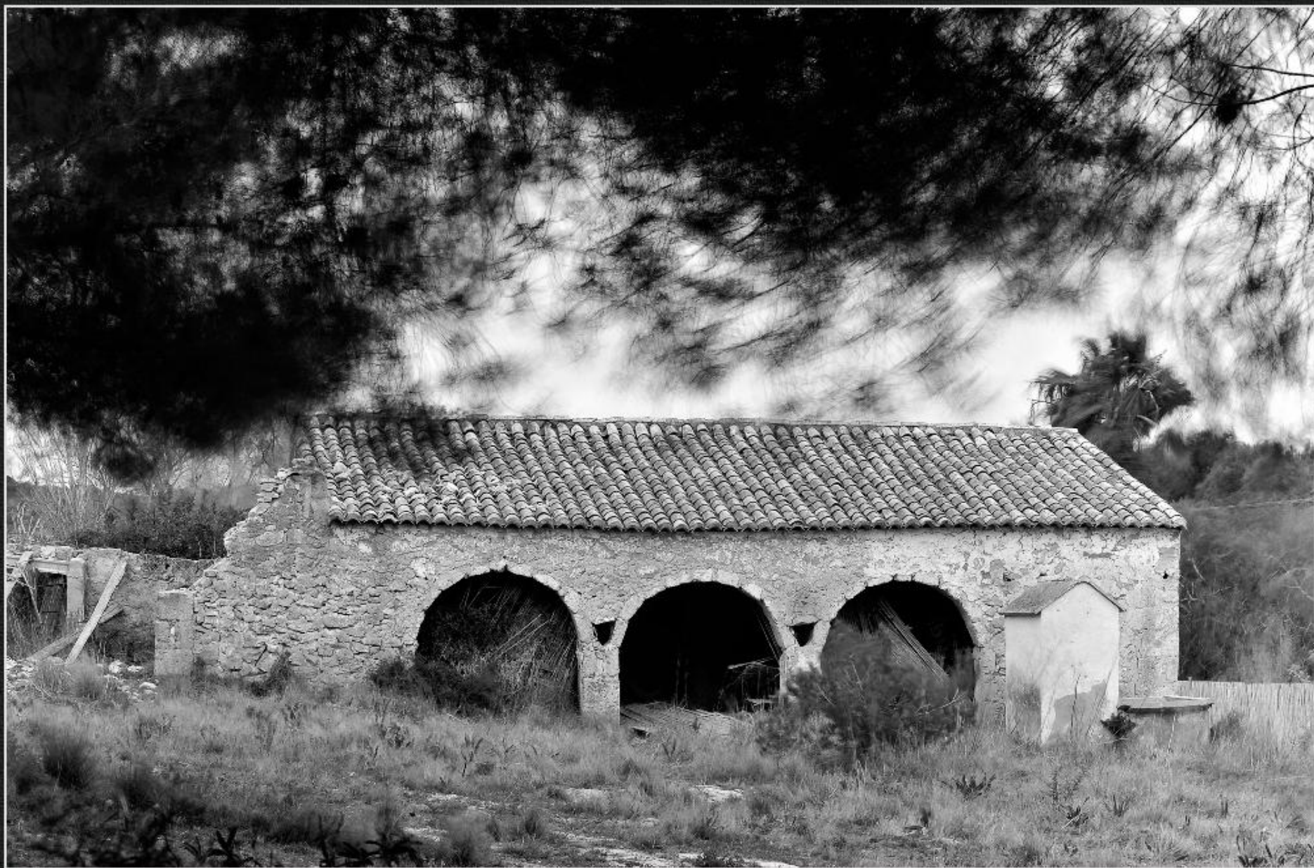
Estufa de la caseta dels Gostinos - La Lluça