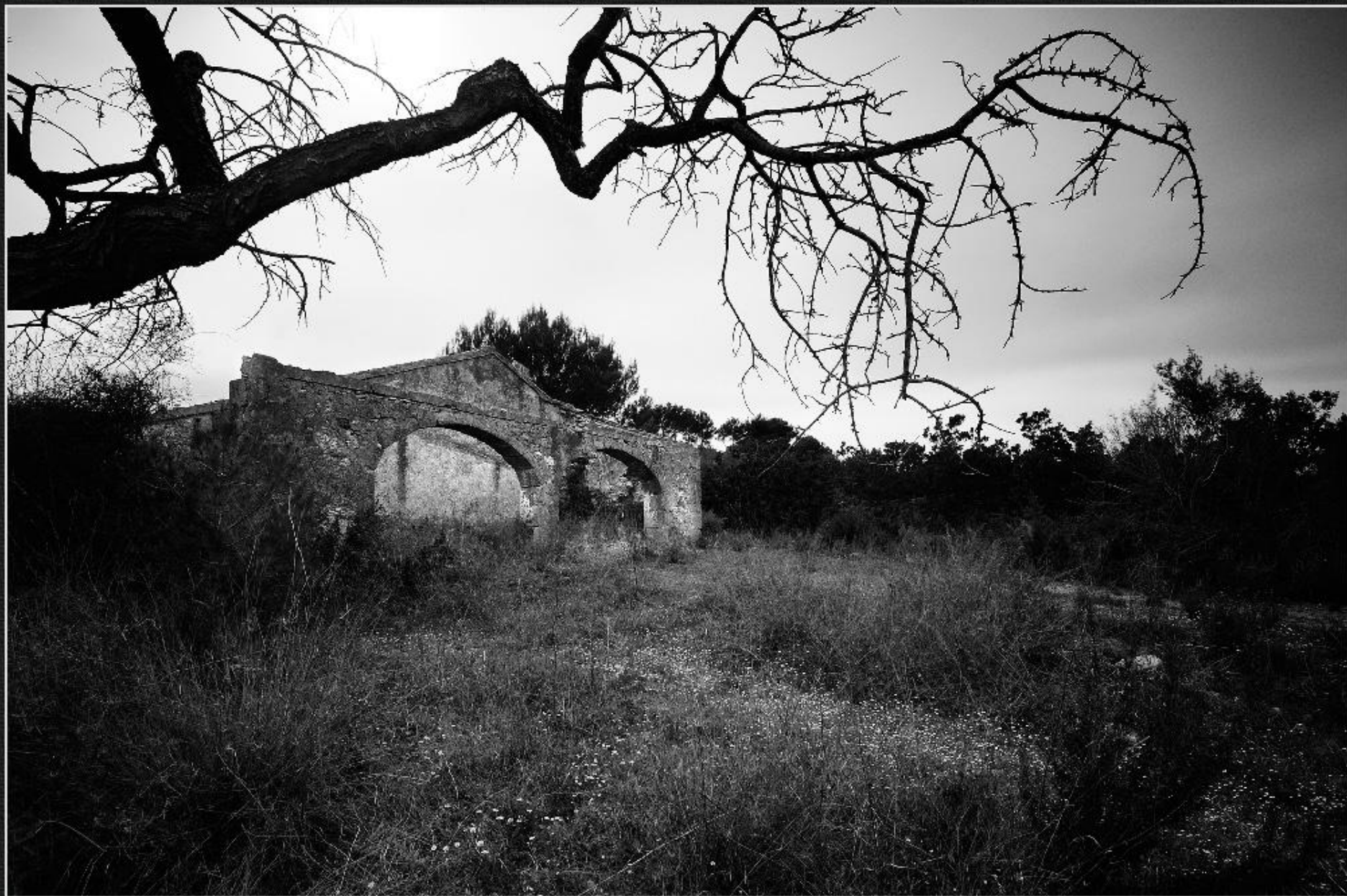
Riurau de Gaspanses