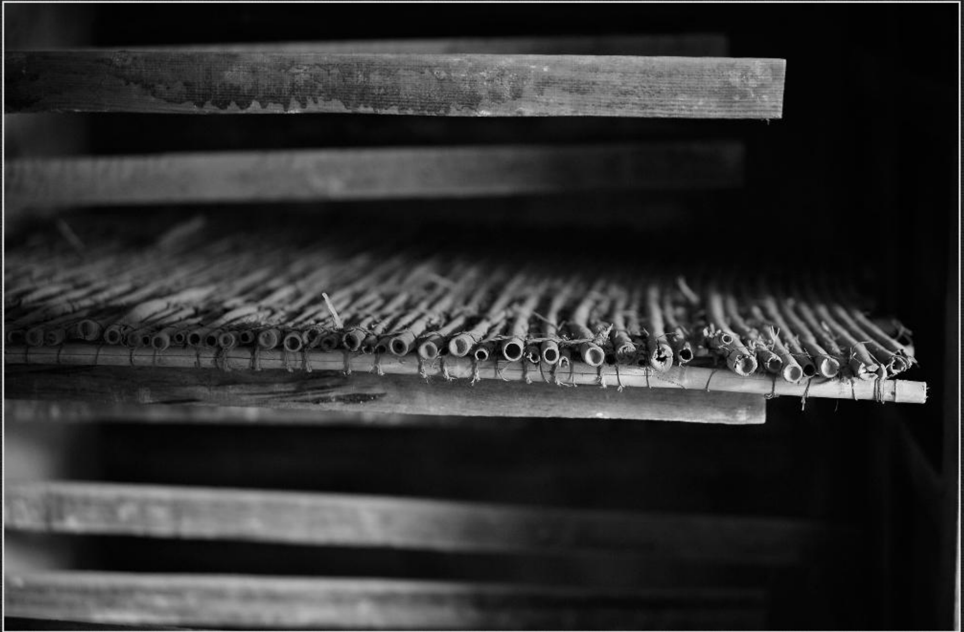
Estaques i canyissos. Estufa de la caseta dels Gostinos - La Lluça