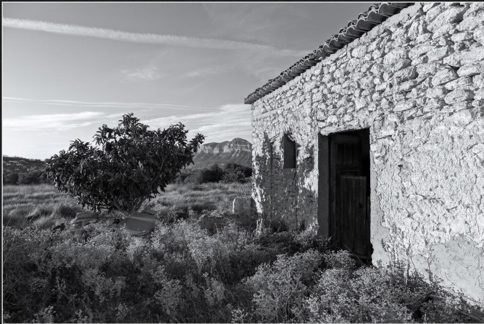
Casup Cansalades