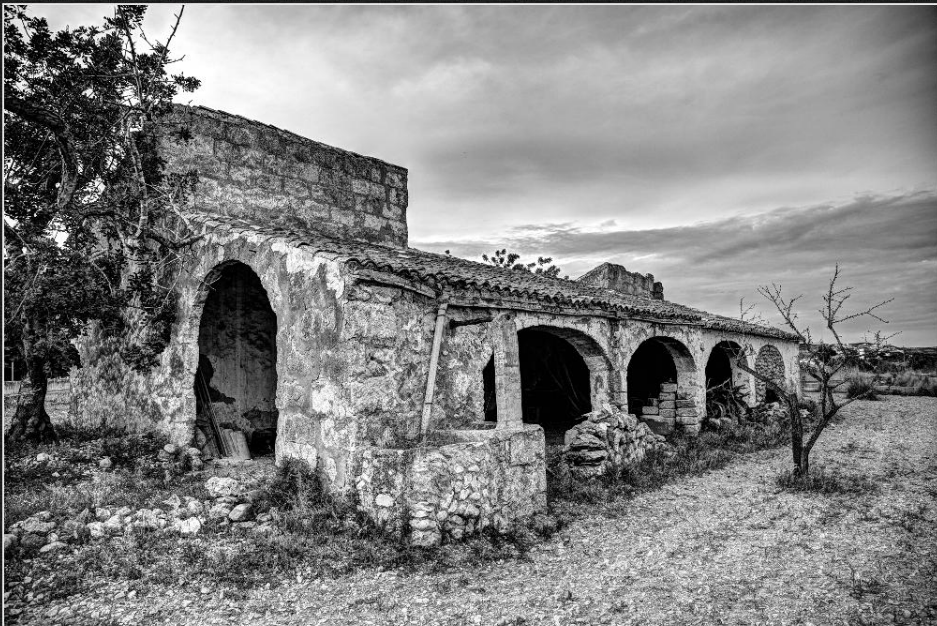
Riurau del Clot de Larion - La Riba