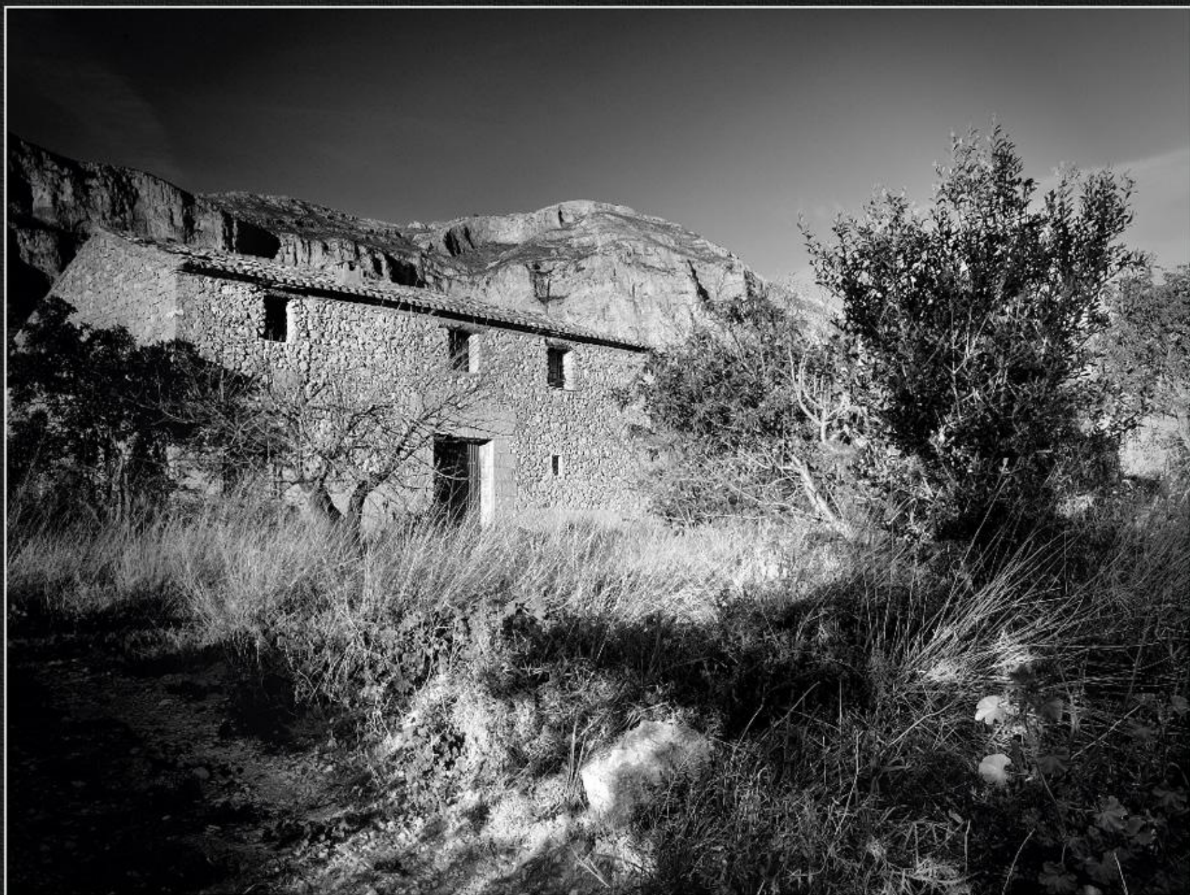
Alqueria - Les Valls