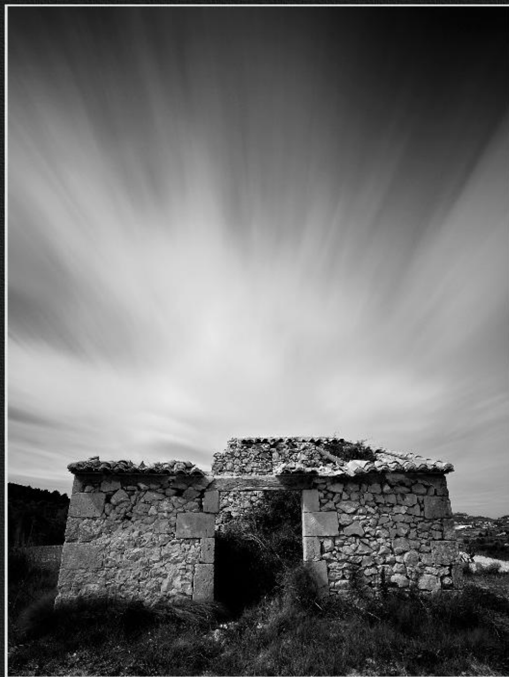
Frontera casup - La Tarraula