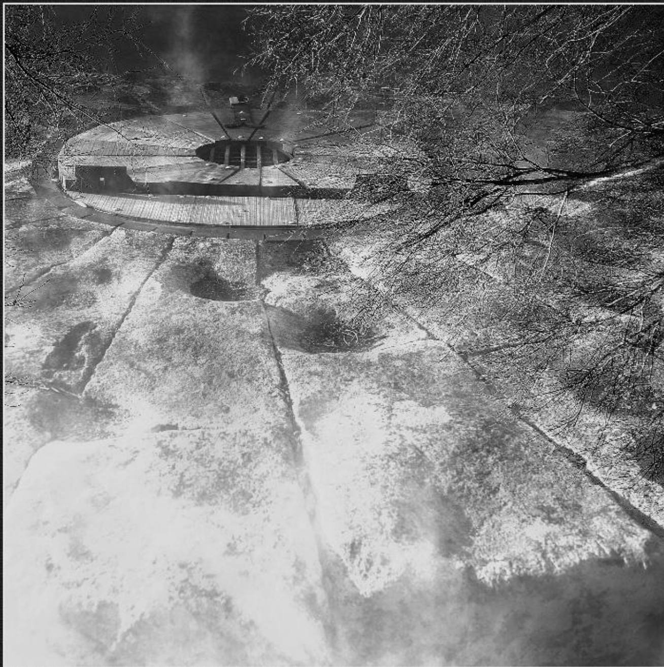
Pou de Castells - Senioles