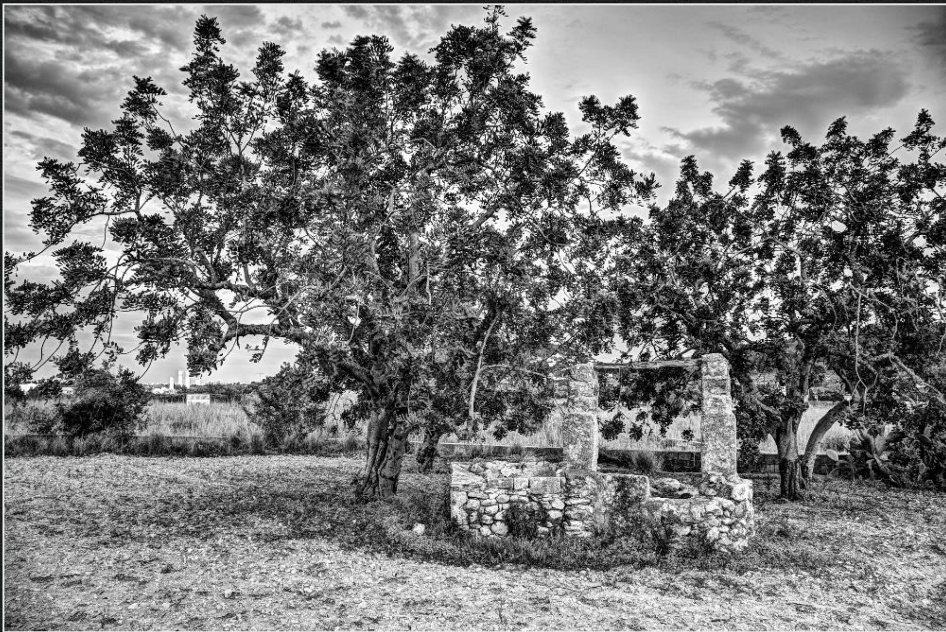
Pou i safreig. Riurau del Clot de Larion - La Riba