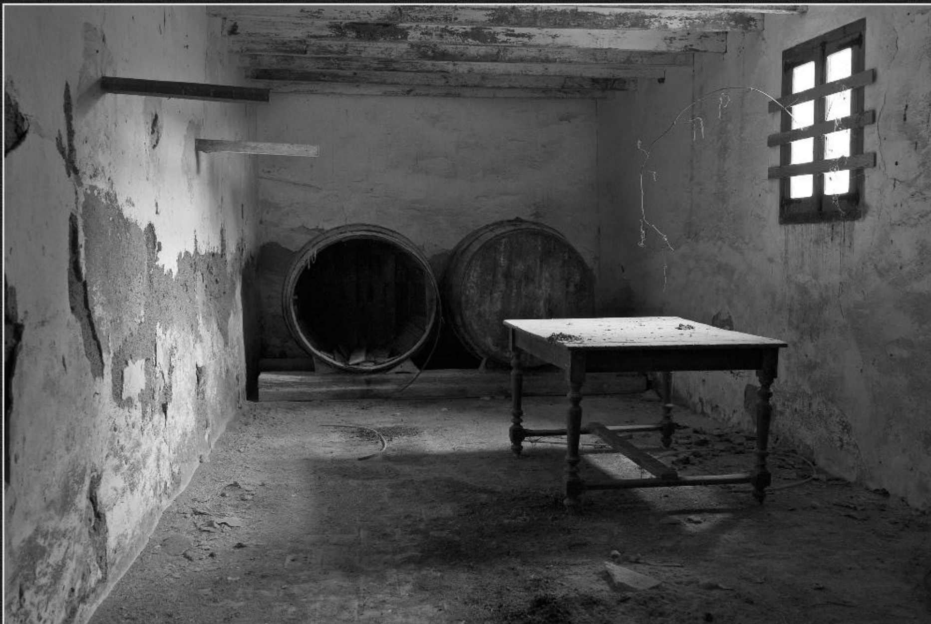
Botes i taula. Riurau de la Pegolina - La Lluça