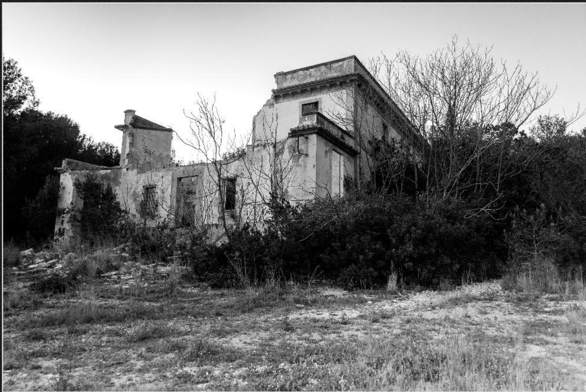
Casa dels Benimeli - El Rafal