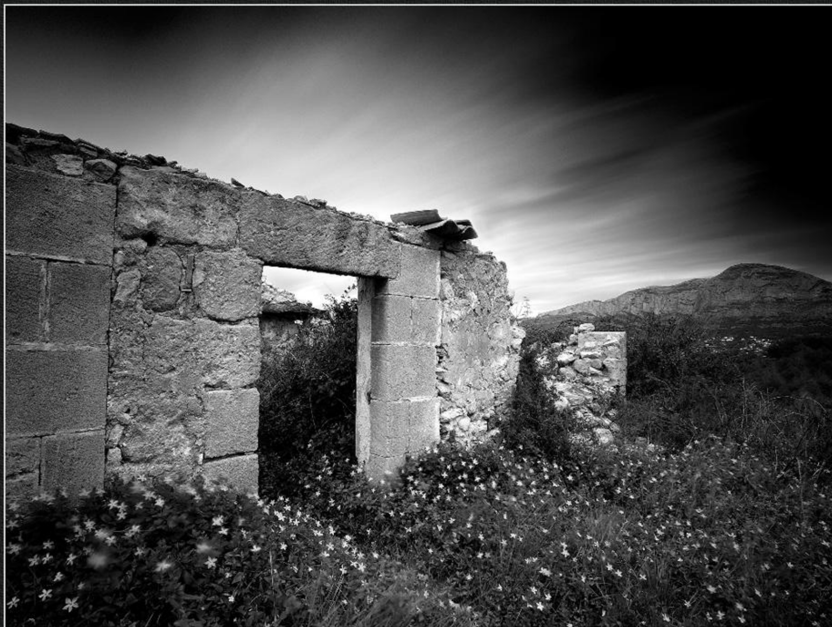
Brancalada de fosques. Casup - La Tarraula