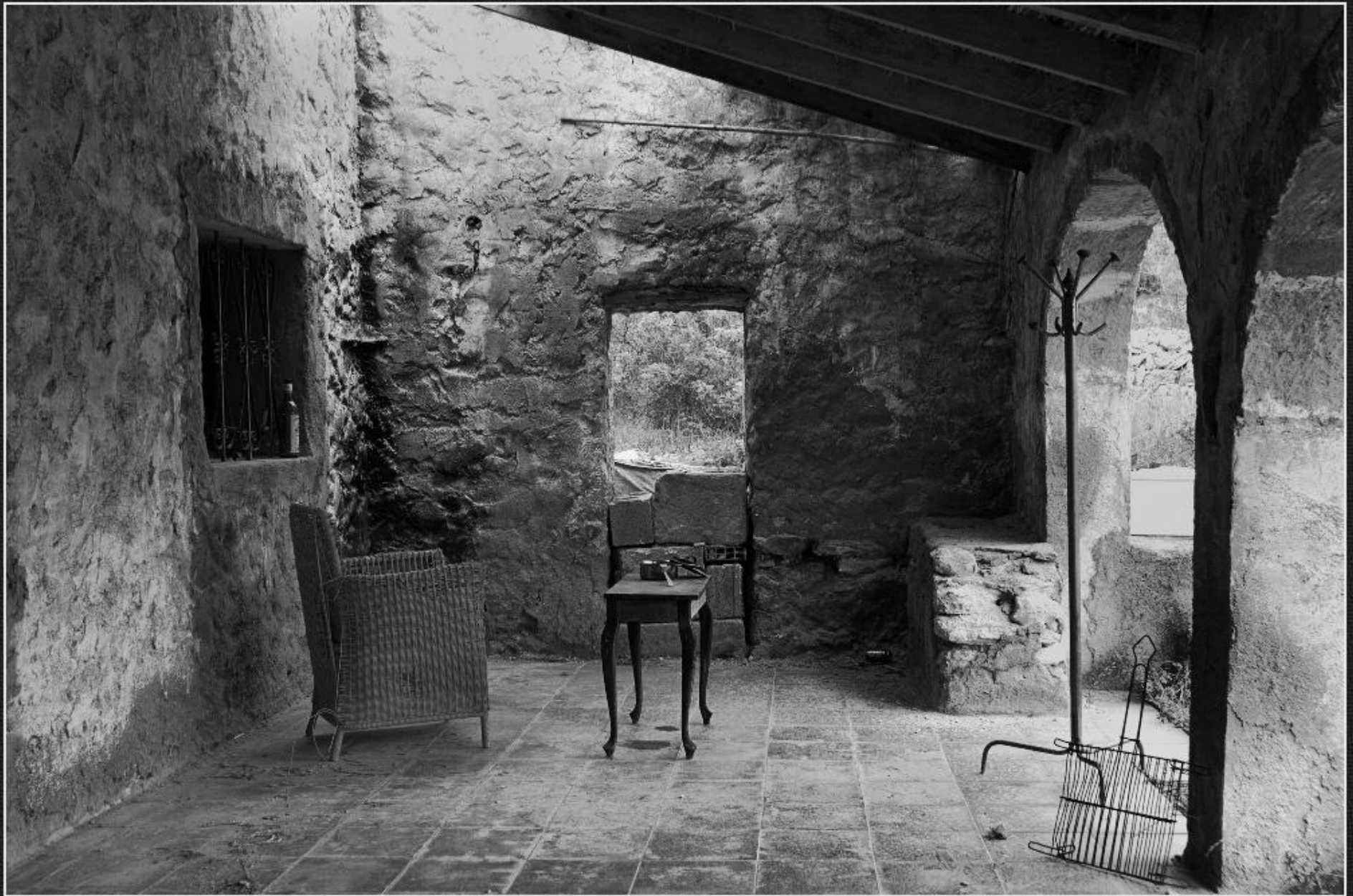
Interior riurau del Mosso - El Rifalet