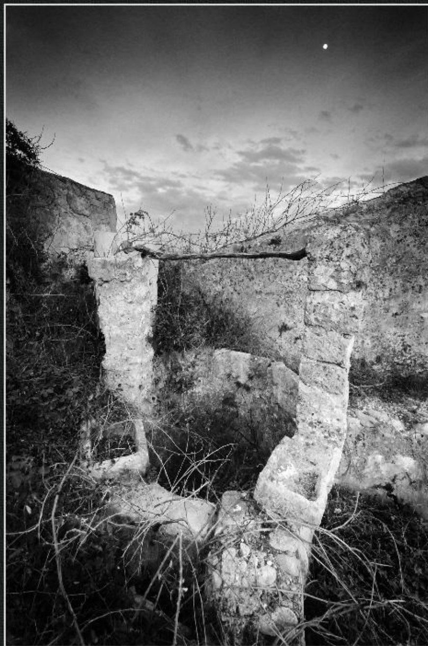
Cup del molí de Climent - Les Barranqueres