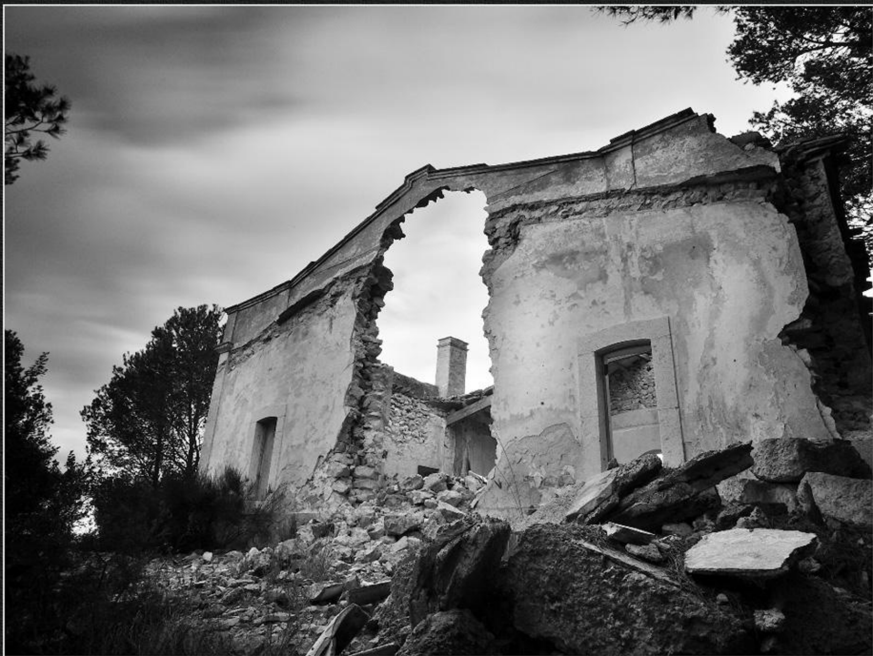
Casa de les Memes - La Plana