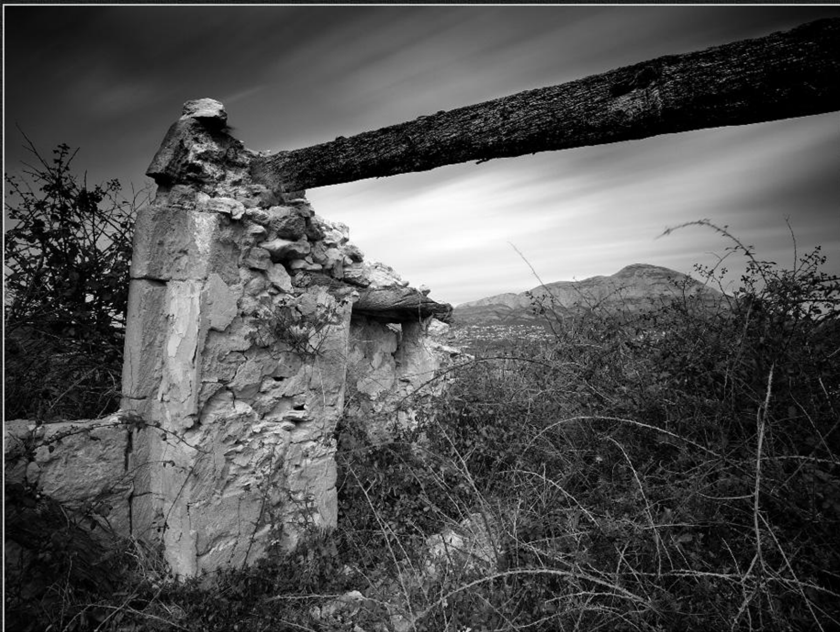
Jässena. Casup - La Tarraula