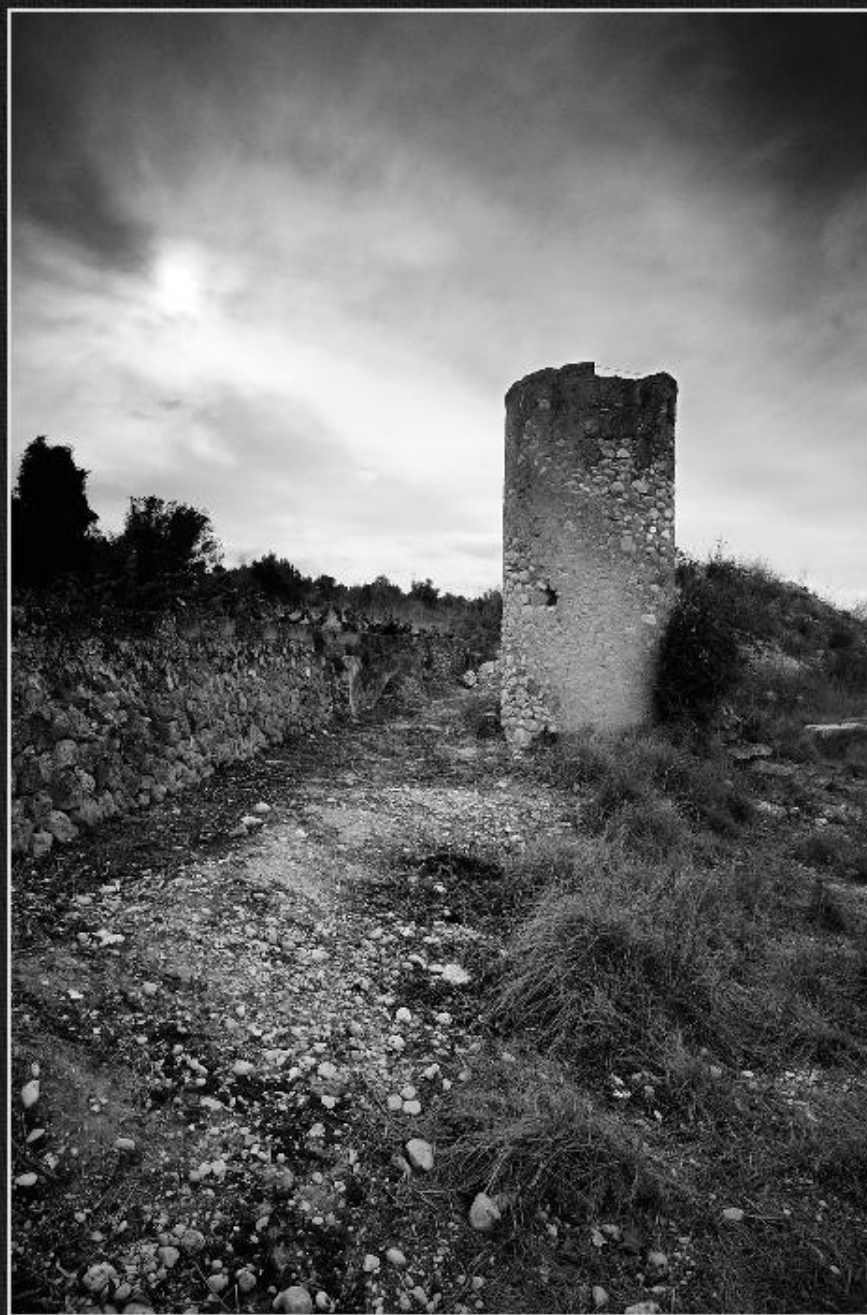
Molinet - Les Fontanelles