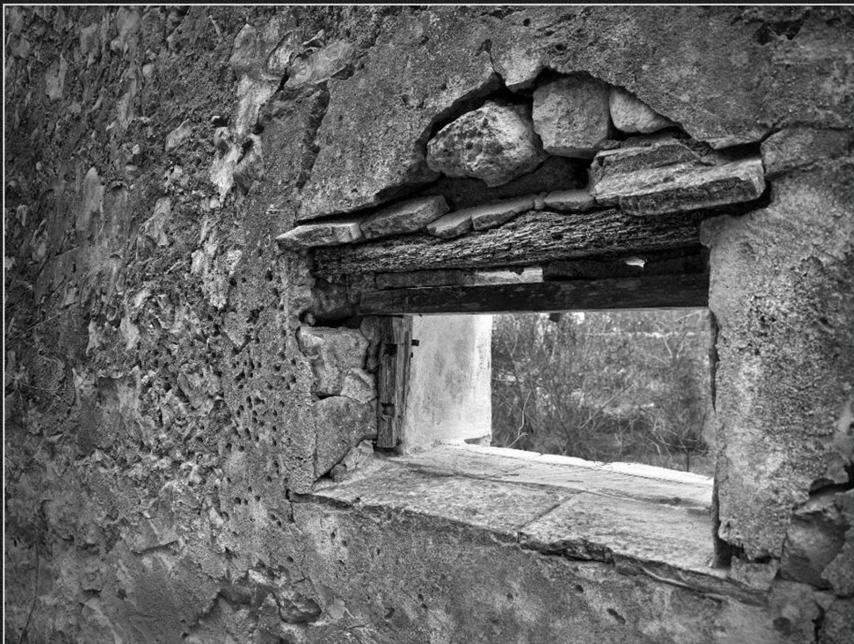
Finestró casa de les Memes - La Plana