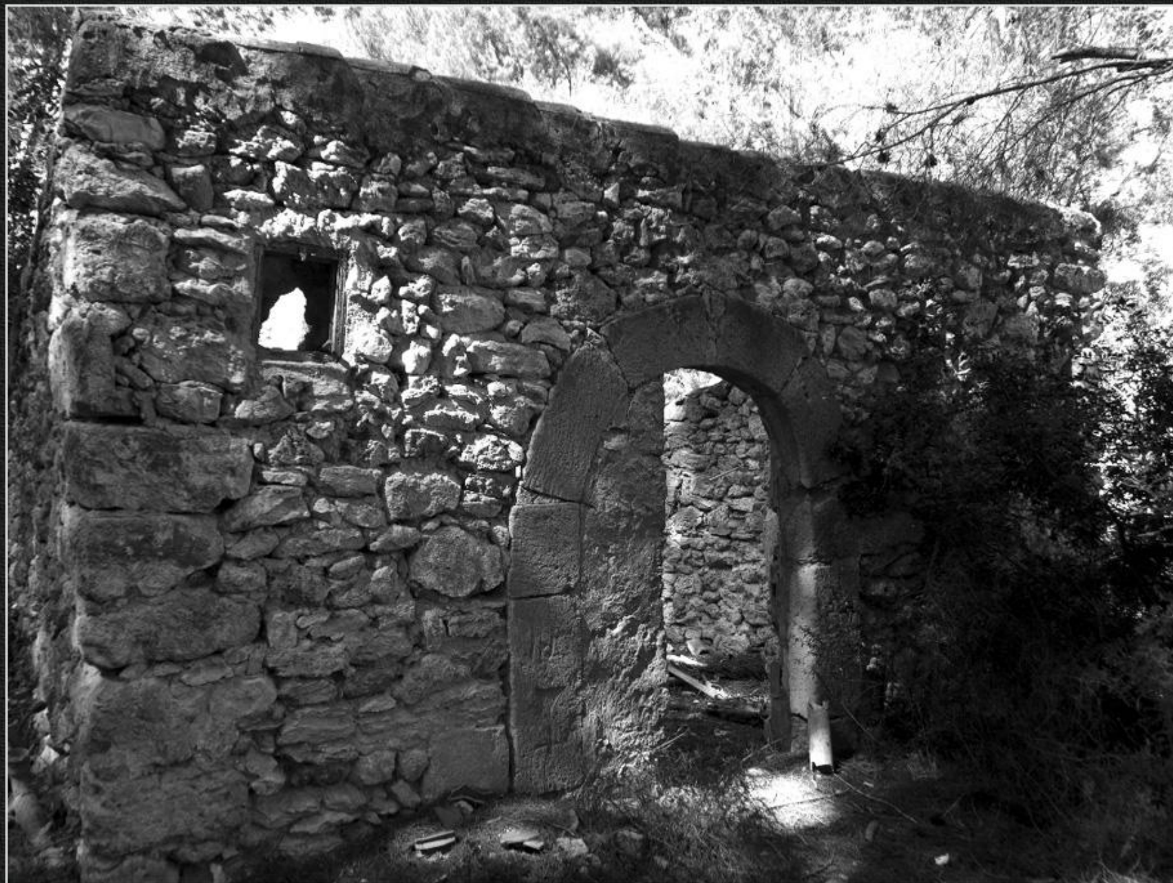
Casup de Cap de Martí