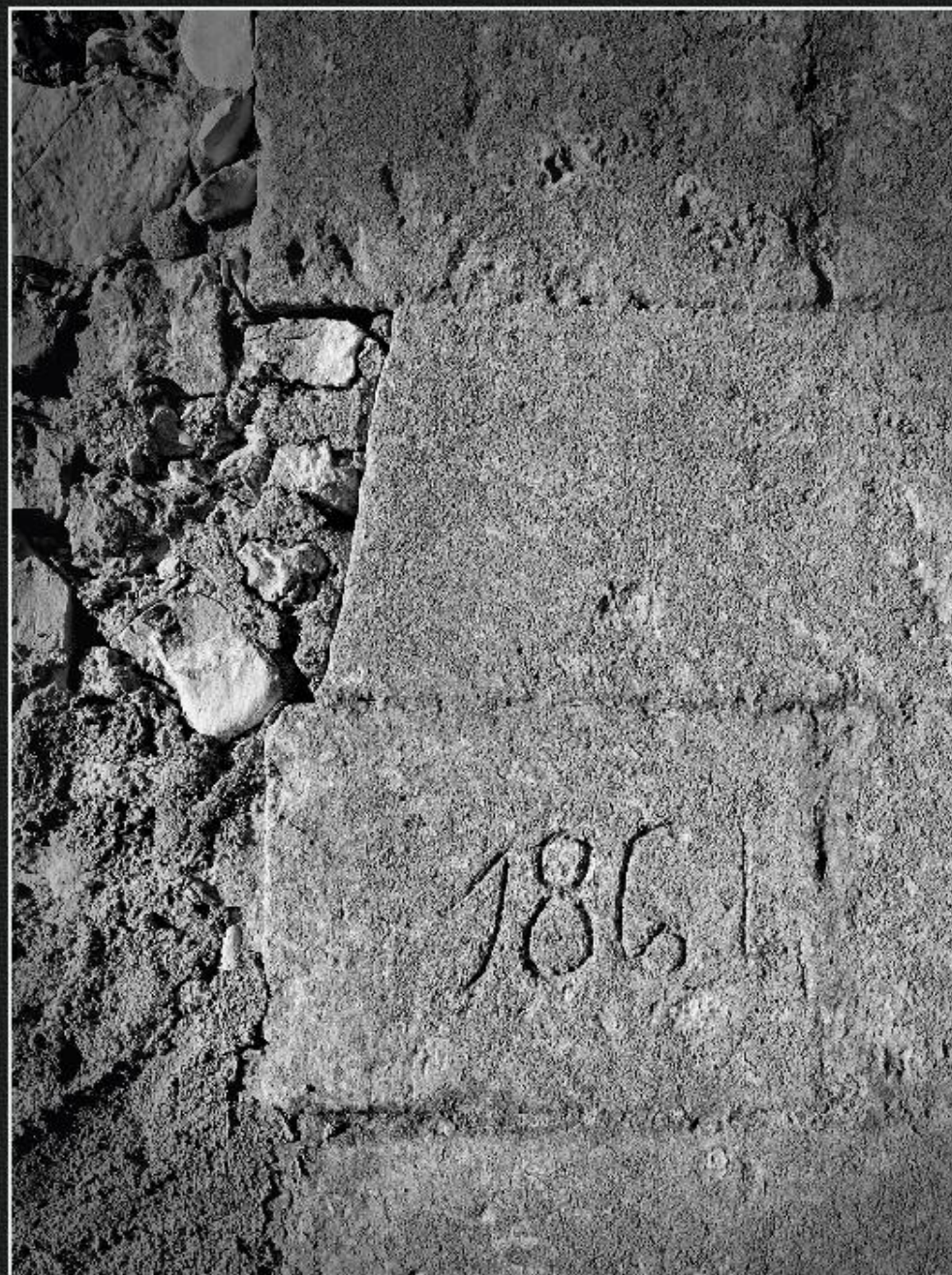
Detall de brancalada. Alqueria - Les Valls