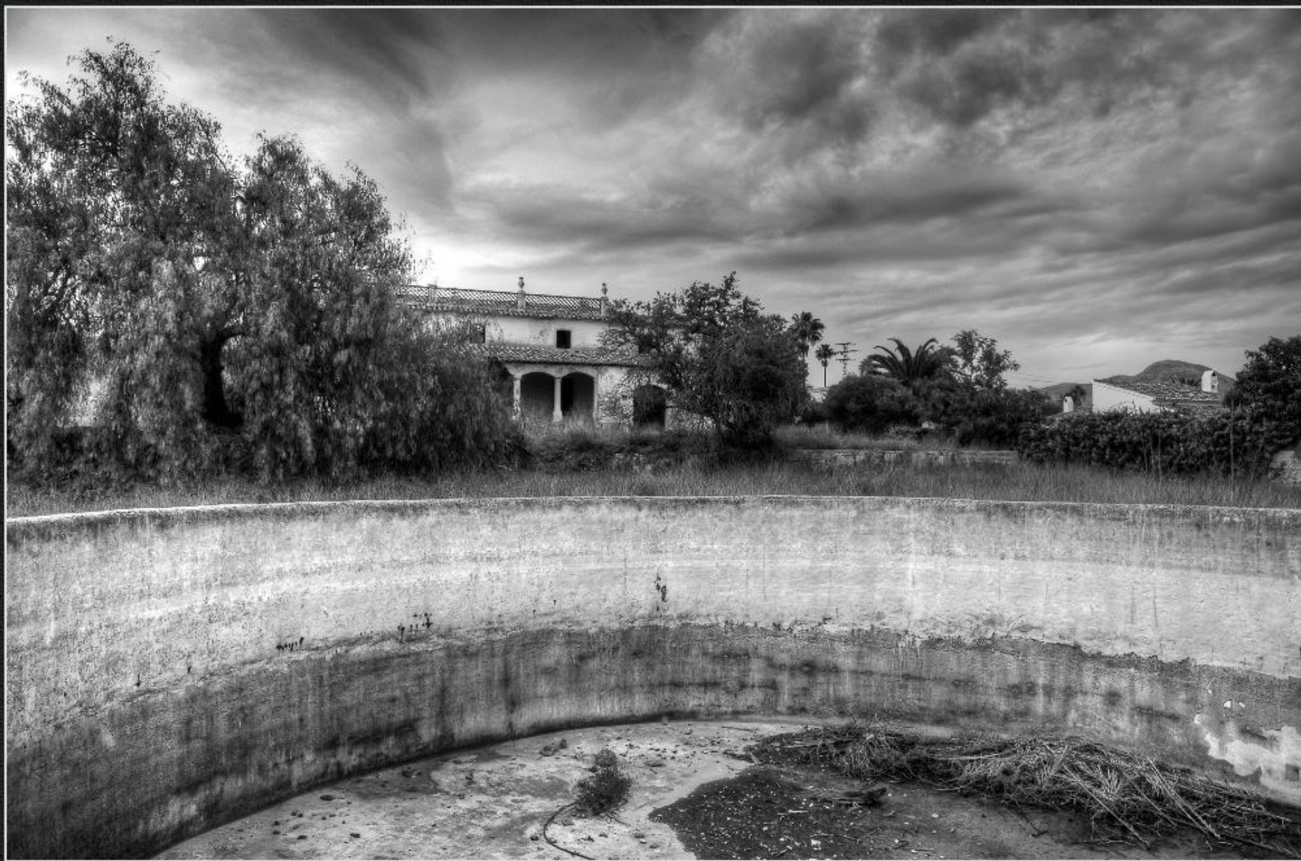
Caseta i bassa de Terra Soler - La Lluça